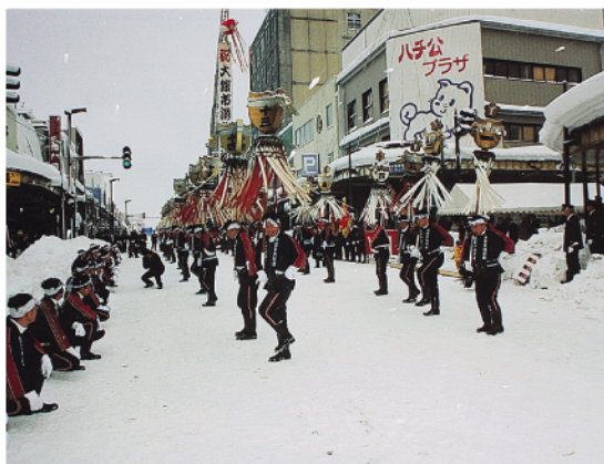
まといふり隊による大館市消防出初式