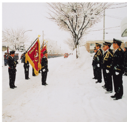
横手市横手消防出初式