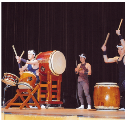
大仙市消防出初式