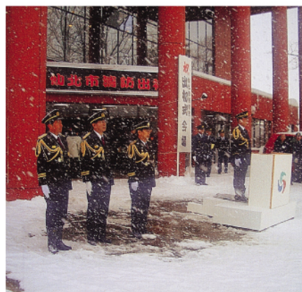
仙北市消防出初式