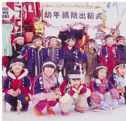
由利本荘市消防出初式