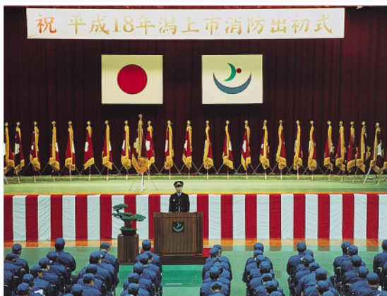
潟上市消防出初式