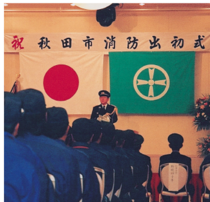
秋田市消防出初式