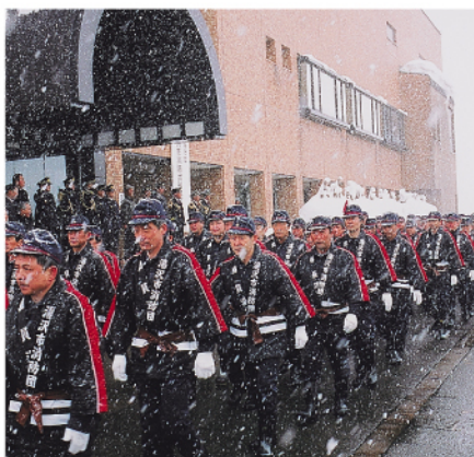
湯沢市消防出初式